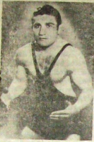
Dünya Sampiyonasuz Gazanfer Pilçe

Geçen hafta spor efkârı umumiyeti aca ve üzücü bir haberle karşılaştık... Kim tahmin edebilir ki Dünya serbest güreş sampiyonası Gazanfer Pilçe verememiş yalaya düşmüş?..